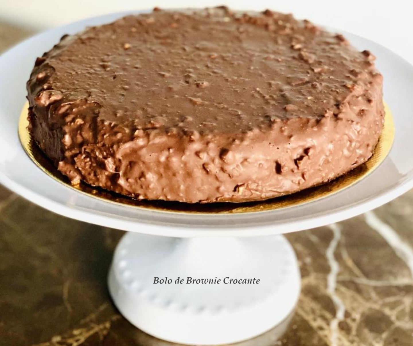
Bolo de Brownie Crocante