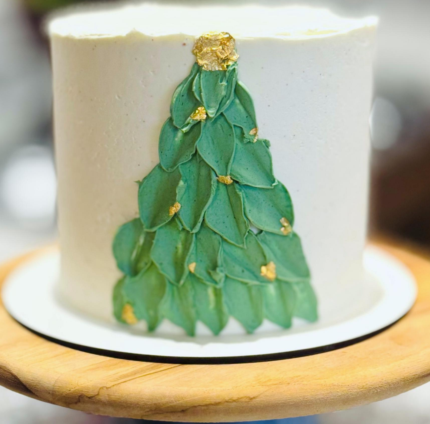
Bolo Arvore de Natal